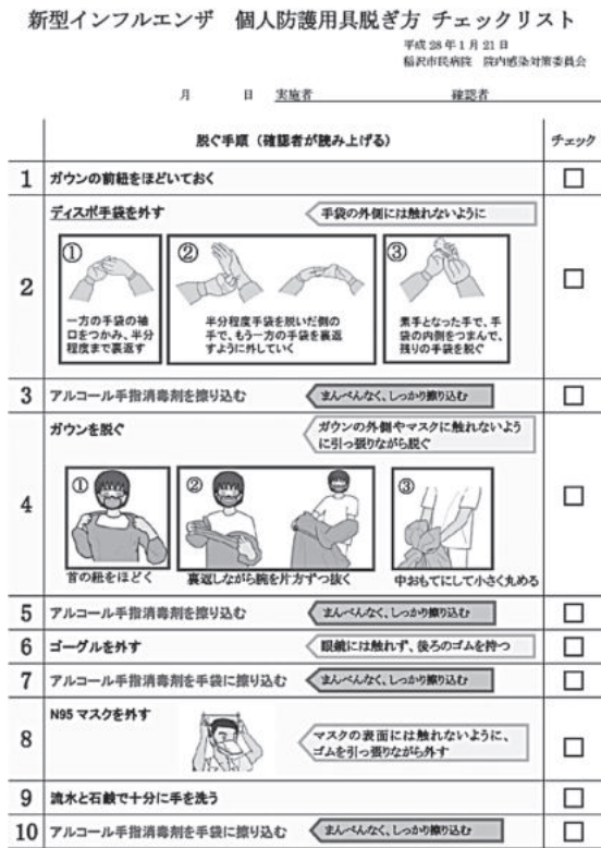
図2. 個人防護用具脱ぎ方チェックリスト

ルス陽性患者は、家族内感染者が多く、面会や差し入れができないケースが多かった。看護師は、小児患者に対しては、なぜ、家族と離れた入院が必要か丁寧に説明し、夜、一人で泣いているときは傍にいた。高齢患者に失見当識の症状がみられたときは、別の病院に隔離入院している離れた家族とテレビ電話で会話できるように設定した。また、症状が改善せず先の見えない状況に悩む患者の気持ちを傾聴し、励まし寄り添う看護を実践した。